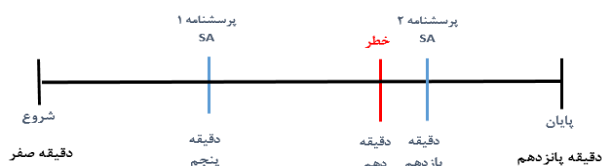
شکل ۲- مراحل انجام آزمایش

شبیه‌ساز رانندگی اتوبوس آکیا Full 301 BI توسط دانشگاه خواجه‌نصیر ساخته شده است برای ارزیابی عملکرد رانندگان استفاده شد (شکل ۳).