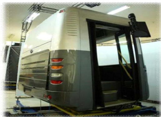
شکل ۳- شبیه‌ساز رانندگی اتوبوس آکیا Full 301 BI