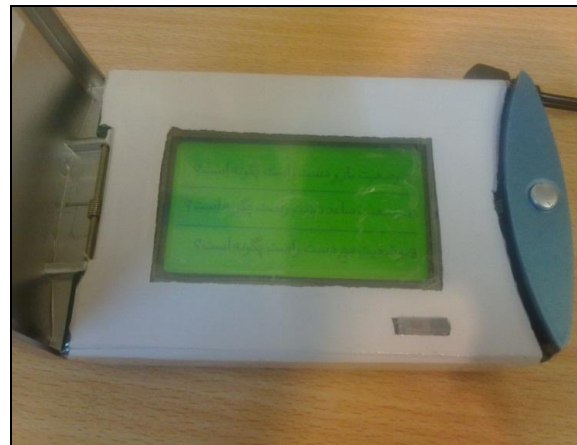
شکل ۴: نمونه‌ای از سوالات ارزیابی پوسچر به روش RULA

در این سیستم ورود داده‌ها توسط فرد ارزیابی کننده با استفاده از صفحه لمسی انجام می‌شود. نمونه‌ای از سوالات در شکل ۴ آمده است.