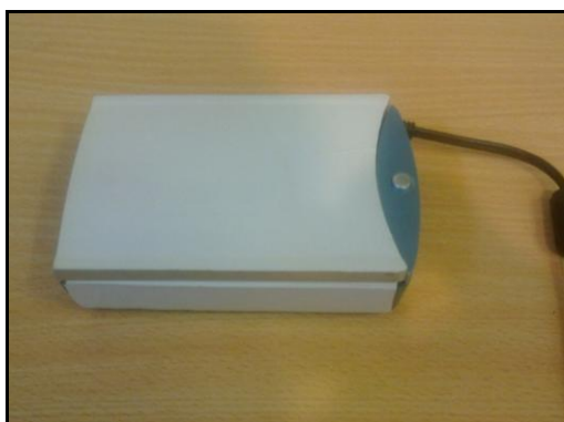
شکل ۳: تصویر PDA

تصویر دستیار دیجیتال شخصی ساخته شده در شکل ۳ آمده است. وزن این سیستم ۳۰۰ گرم و دارای ابعاد ۱۳×۸×۳/۵ سانتی‌متر می‌باشد.