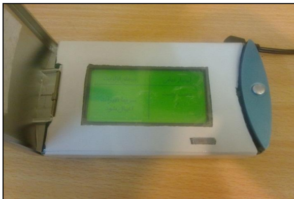
شکل ۵: نمونه‌ای از نتایج نهایی ارزیابی پوسچر به روش RULA

سیستم ۶/۲ \pm ۸۴/۲ بدست آمد که بر اساس مقیاس طبقه‌بندی در رتبه B و محدوده قابل قبول و وضعیت خیلی خوب قرار گرفت. جهت تعیین پایایی نیز آلفای کرونباخ محاسبه شد و مقدار آن ۰/۷۱۶ بدست آمد. همچنین ضریب همبستگی پیرسون بین امتیاز کل دو بار پر کردن پرسشنامه توسط کارشناسان بهداشت حرفه‌ای، برابر ۰/۸۸۸ بدست آمد ( P < ۰/۰۰۱ ).