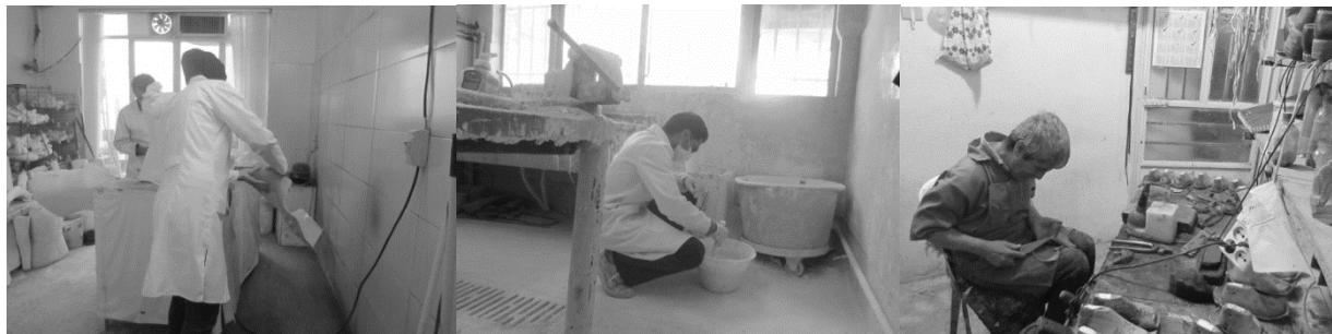
شکل ۱: برخی از پوسچر های نامطلوب افراد حین انجام کار در کلینیک ساخت اعضای مصنوعی و وسایل کمکی در انجام وظایف کفاشی، پرکردن قالب و کار با سمباده. الف) کفاشی، ب) پر کردن قالب نگاتیو از گچ، پ) کار با دستگاه سمباده

و اژه برای برش اعمال کند که نبودن تکیه‌گاه جهت فرارگیری قالب بر روی آن نیز باعث تشدید موارد گفته شده می‌شود. استفاده از اژه برقی ایستاده و ثابت و همین‌طور استفاده از سکویی (Stand) که قالب‌ها بر روی آن قرار گیرد، می‌تواند از فشار وارد آمده به فرد و پوسچر های نامطلوب وی حین انجام کار جلوگیری نمود. برش ورق‌های فلزی با استفاده از گیوتین نیز به دلیل اعمال نیرو جهت نگه‌داشتن ورق فلزی در ارتفاع پایین (در مواردی که گیوتین بر روی زمین قرار گرفته است) و در ارتفاع بالا (در مواردی که گیوتین بر روی میز قرار گرفته است) و همچنین دور شدن بازوها از بدن به دلیل وجود دسته‌بلند گیوتین و اعمال نیرو بر آن، می‌تواند آسیب‌هایی را به اندام‌های درگیر وارد کند. در اکثر مطالعات انجام شده، پوسچر نامطلوب به‌عنوان عامل مهم در وقوع اختلالات اسکلتی-عضلانی، شناخته شده است. دلیل اصلی پوسچر غیرطبیعی و ثابت را می‌توان ایستگاه‌های کار غیرقابل تنظیم دانست (۸). در مطالعاتی که توسط چوبینه و همکاران (۸)، لین و چن (۱۸) و ویکی و متیلا (۵) بطور جداگانه انجام شده است، نشان داده‌اند که پوسچر کاری می‌تواند در بروز اختلالات اسکلتی-عضلانی مؤثر باشد.