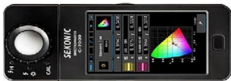
شکل ۲. دستگاه اسپکترورادایومتر SEKONIC-7000

این مطالعه توصیفی، تحلیلی - مقطعی است که بین کارکنان اداری ستاد وابسته به دانشگاه علوم پزشکی همدان با هدف تعیین اثر روشنایی بر علائم و دردهای اسکلتی-عضلانی و ارتباط آن با پوسچر کاری در فصل بهار و اواخر فروردین ماه سال ۱۳۹۶ در طول شیفت کاری انجام شد. اندازه‌گیری روشنایی در ۵۰ اتاق به صورت تصادفی ساده انجام شد. در این مطالعه، خصوصیات کمی روشنایی با دستگاه SEKONIC-7000 در ارتفاع سطح کار (سطح افق) و عمود (ارتفاع چشم فرد) در ساعات بین ۸ تا ۱۴ و در سه نوبت اندازه‌گیری انجام شد. دستگاه سکونیک C-7000، یک دستگاه اسپکترورادایومتر است که می‌تواند در محیط آزمایشگاه و محیط استفاده واقعی انواع منابع روشنایی، به طور همزمان دمای رنگ، شاخص تجلی رنگ و تجزیه طیف را به همراه شدت روشنایی اندازه‌گیری و ثبت کند. این دستگاه با قابلیت پردازش رنگ و تصحیح آن به صورت آنلاین برای تمام نورها اعم از نور طبیعی و مصنوعی، به صورت پیوسته یا نور لحظه‌ای، برای انواع کاربردهای مختلف صنعتی، پزشکی، علمی و هنری استفاده می‌شود. دستگاه دقت بالای ۱ نانومتر دارد. در شکل ۲ دستگاه کلون متر نشان داده شده است. در مطالعه حاضر، براساس فرم‌های مصوب مرکز سلامت محیط و کار، ویژگی‌های کیفی اتاق‌ها و مشخصه‌های کمی و کیفی روشنایی بررسی شد. شدت روشنایی عمومی براساس الگوهای پیشنهادی انجمن مهندسان روشنایی (IES)، شدت روشنایی موضعی دقیقاً در محل دید فرد با زاویه‌ها و فاصله مناسب با رعایت جلوگیری از تشکیل سایه و نیم سایه بدن یا دست روی محل و تغییر نکردن وضعیت و جابه‌جایی فرد، با قراردادن دستگاه در حالت افقی و عمودی اندازه‌گیری انجام شد.