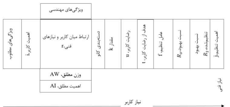
شکل ۲. شکل توسعه ویژگی‌ها (HOQ)

شکل ۲ ماتریس کیفیت HOQ را نشان می‌دهد، که در این بررسی اجرا شده است. همان‌طور که در این ماتریس دیده می‌شود، نتایج مرتبط با انتظارات کاربر، که از طریق