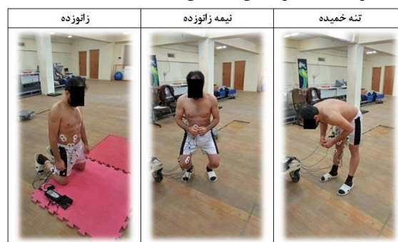
شکل ۱. پوسچرهای ارزیابی شده در مطالعه

با بررسی فرایند جوشکاری در خطوط انتقال گاز، مصاحبه با جوشکاران و همچنین بررسی عکس‌ها و فیلم‌های تهیه شده از آنها هنگام جوشکاری در مناطق عملیاتی، پوسچرهای غالبی که جوشکاران هنگام کار داشتند شناسایی شد. این پوسچرها شامل سه پوسچر تنه خمیده به سمت جلو (تنه با زاویه ۹۰ درجه نسبت به محور عمودی بدن)، پوسچر نیمه زانورده (زاویه فلکشن زانو ۱۲۰ درجه) و پوسچر زانورده (هر دو زانوی فرد روی زمین قرار دارد و تنه بدون زاویه نسبت به محور عمودی بدن) بودند. پوسچرهای ارزیابی شده در مطالعه، در شکل ۱ نشان داده شده است.