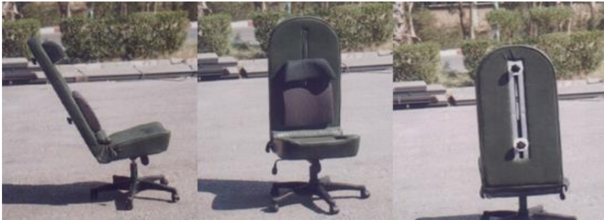
شکل ۳. صندلی ارگونومی ساخته شده، از نماهای مختلف