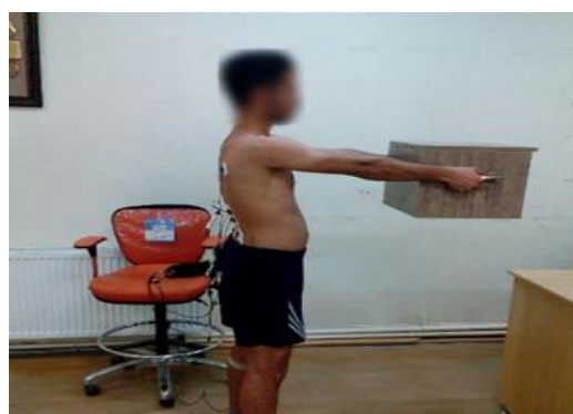
شکل ۱. نحوه قرارگیری آزمودنی‌ها برای انجام آزمایش‌ها

موفق) انجام شد و میانگین متغیرهای مربوط، در ۵ حرکت محاسبه شد. بین تلاش‌های آزمون در هر کدام از دو وضعیت (همچنین بین تعویض آزمون‌ها از حالت نگه‌داشتن ایستا به حالت برداشتن پویا)، دست‌کم ۳۰ دقیقه به آزمودنی‌ها استراحت داده می‌شد تا خستگی انجام تست برطرف شود. نحوه انجام آزمون‌ها نیز در وضعیت‌های با گوه پاشنه و بدون آن، به صورت تصادفی بود تا اثر یادگیری و ترتیب اجرای آزمون روی داده‌های ثبت شده خنثی شود. گوه استفاده شده در پژوهش حاضر از جنس چوب با این ابعاد بود: طول ۷ سانتی متر، عرض ۵ سانتی متر و ارتفاع ۱ سانتی متر با زاویه ۸ درجه، که میان چوب در زیر پاشنه پاها قرار داده می‌شد [۹].