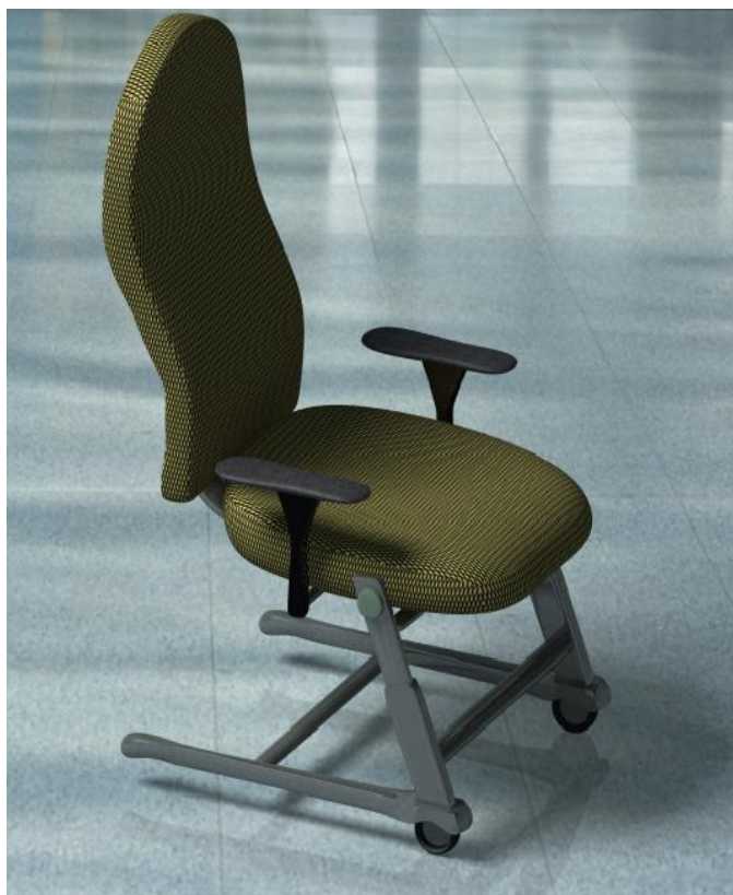
شکل ۳: نمای ایزومتریک پروتوتایپ

خوشبختانه، ارتقا سطح دانش عمومی و بالا رفتن توانمندی‌های بالقوه شاغلین از یک طرف، و پیاده‌سازی برنامه‌های ارگونومی از طرف دیگر، زمینه‌ساز افزایش روز افزون کیفیت محصولات مورد استفاده، و نیز طراحی بهینه ابعاد مختلف ایستگاه‌های متنوع کاری در صنایع مختلف کشورمان بوده است. نتایج حاصل از این مطالعه نیز ضمن تأکید بر لزوم اجرای مطالعات کمی در محیط‌های صنعتی، حاکی از موفقیت آمیز بودن جلب مشارکت کارکنان در طراحی محیط کار و رفع نقاط ضعف موجود می‌باشد.