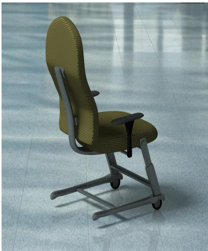
شکل ۲: نمای ایزومتریک پروتوتایپ

با توجه به نتایج حاصل از این مطالعه، شرکت‌کنندگان، ثابت بودن صندلی و دشوار بودن جابجایی آن را جز مشکلات استفاده از صندلی‌های موجود برشمردند؛ و چرخ‌دار بودن صندلی جهت جابجایی راحت آن را به عنوان راه حل ذکر کردند. همچنین چهار پره بودن پایه صندلی را یکی از مشکلات آن ذکر کرده و استفاده از ۵ پره به جای ۴ پره، جهت حفظ تعادل بیشتر را پیشنهاد نمودند. اما از آنجا که یکی دیگر از مشکلات صندلی‌های موجود، گیر کردن پایه صندلی به میز و ممانعت از جلو آمدن آن بود، خود شرکت‌کنندگان، استفاده از پایه‌های مثلی را برای جلوگیری از برخورد آن با میز کار، توصیه کردند. مدل مفهومی صندلی صنعتی در این مطالعه که مطابق با خصوصیات آنتروپومتریک جمعیت آماری و نیز ملاحظات شناختی آنان در رابطه با ویژگی‌های مربوطه طراحی شد در شکل‌های ۲ و ۳ نمایش داده شده است.